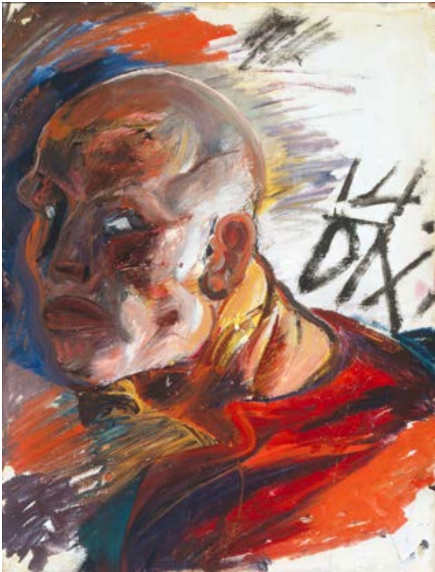
Otto Dix, Selbstbildnis als Soldat, 1914, Öl auf Papier, 68 x 53,5 cm, Kunstmuseum Stuttgart, © VG Bild-Kunst, Bonn

Kein Krieg darf sein. Wenn es schon die Bevölkerungen nicht schaffen, Konflikte friedlich zu lösen, so müssen die Politik und die Diplomatie den Ausbruch von Kriegen verhindern. Der Journalismus hat dazu die Verpflichtung, auf die Krisenherde und die Schrecknisse aufmerksam zu machen, am direktesten gelingt ihm dies mit Filmen und Fotografien. Aber auch die Künstler protestieren mit Worten, Bildern und Klängen gegen Krieg. So gibt es berühmte Denkmäler, die über die Erinnerung an die furchtbaren Verbrechen hinaus zum Frieden aufrufen. Dazu gehören etwa Picassos monumentales Gemälde „Guernica“ (1937) in Madrid und die riesige Skulptur „Die zerstörte Stadt“ (1951-53) von Ossip Zadkine in Rotterdam. Beide Werke haben das Entsetzliche des Krieges, für das die Worte fehlen, in anschauliche Bilder gefasst