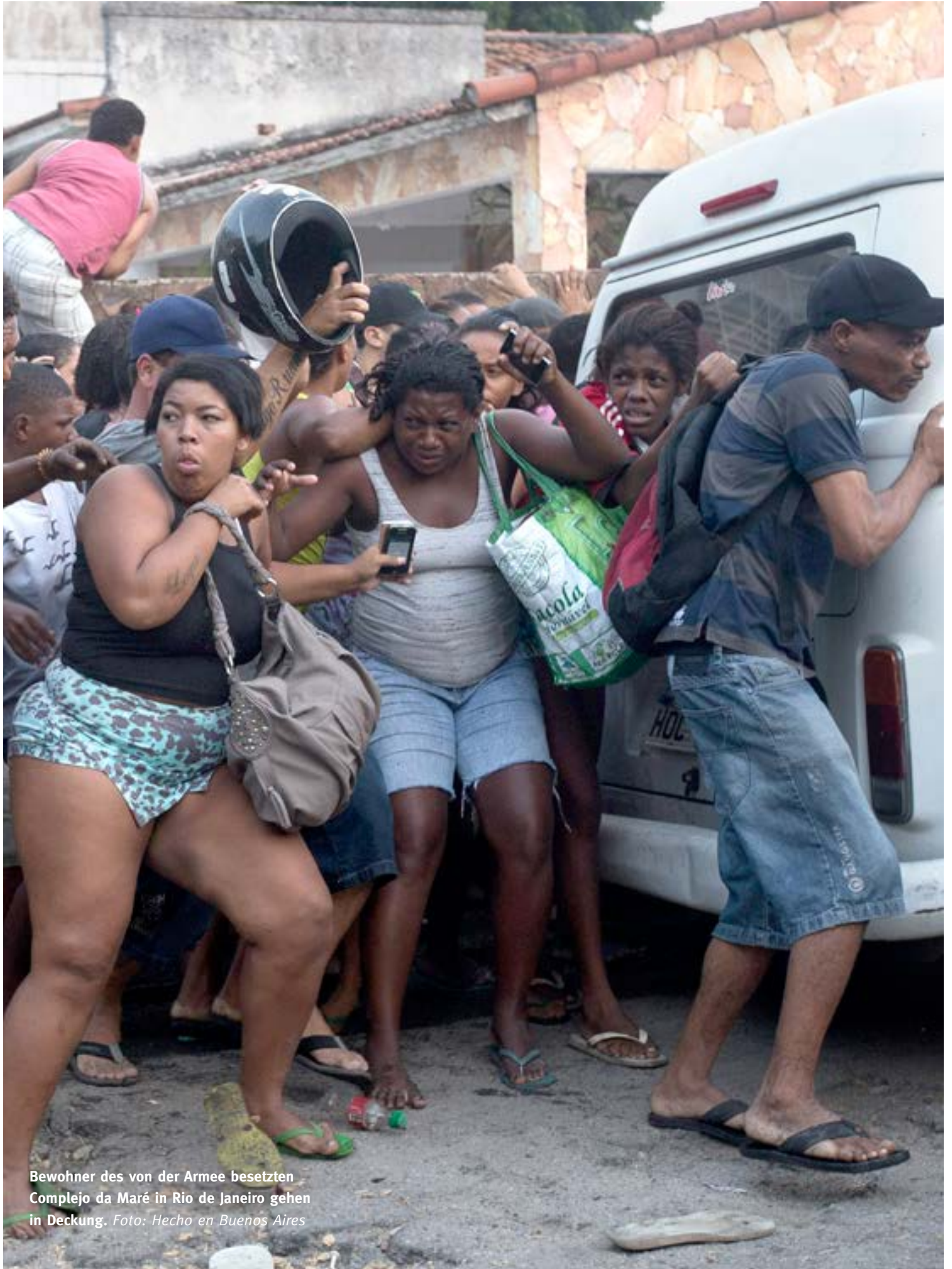
Bewohner des von der Armee besetzten Complejo da Maré in Rio de Janeiro gehen in Deckung.