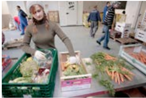
Traurig: 1,5 Millionen Menschen in Deutschland sind auf die Tafeln angewiesen.

(dpa/W). Studierende und Asylbewerber sind nach Angaben der deutschen Tafeln zunehmend auf kostenlose Lebensmittel angewiesen. „Wir brauchen in Deutschland eine menschenwürdige Grundsicherung“, sagte der Vorsitzende des Bundesverbandes, Jochen Brühl. Die Bundesregierung solle sich auch des Problems Altersarmut annehmen. Bedürftige erhalten seit 1993 bei den Tafeln Lebensmittel, die sonst weggeworfen würden. 2013 nutzten rund 1,5 Millionen Menschen in Deutschland dieses Angebot. Der Vorsitzende des Paritätischen Wohlfahrtsverbandes, Rolf Rosenbrock, kritisiert, dass die Armutsquote in Deutschland seit 2008 kontinuierlich angestiegen sei, nämlich von 14,4 auf 15,2 Prozent. Die unteren 20 Prozent der Haushalte hätten durchschnittlich Schulden von 4.600 Euro, die reichsten zehn Prozent der Haushalte verfügten hingegen über ein Nettovermögen von durchschnittlich 1,15 Millionen Euro.