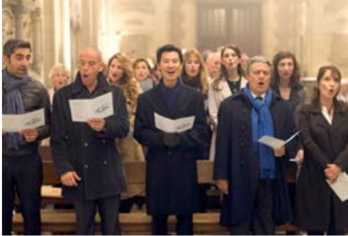
Singe, wem Gesang gegeben: Szene aus „Monsieur Claude und seine Töchter“.