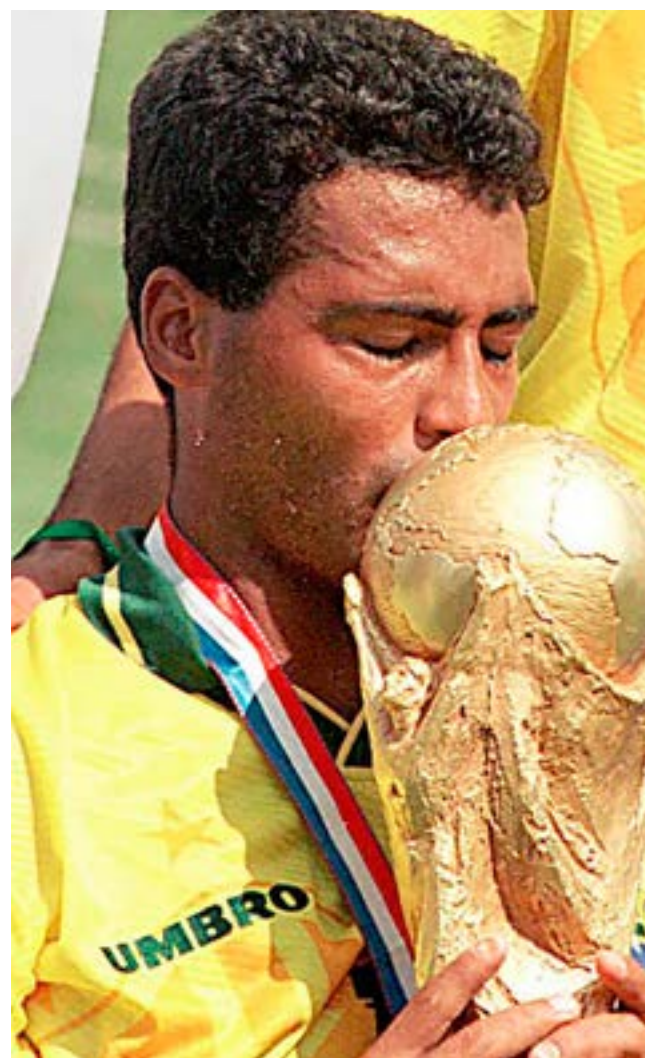
Weltmeister Romário: „Ich bin nicht gegen die WM, sondern gegen die exzessiven Kosten, die die WM verursacht.“

www.street-papers.org / Hecho en Buenos Aires - Argentina