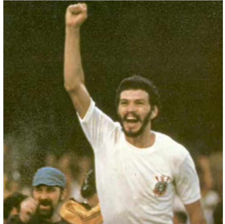
Sócrates war kein Säulenheiliger. Aber er stand für das ein, was ihm wichtig war, und streckte vor den Augen der Militärjunta seine Faust in die Luft.

Sócrates war kein Säulenheiliger. Aber er stand für das ein, was ihm wichtig war, und streckte vor den Augen der Militärjunta seine Faust in die Luft. Im Jahr 1983 war Sócrates schon auf dem Weg nach Italien, seine Karriere sollte dort weitergehen. Doch vor fast zwei Millionen Fans in São Paulo versprach er, dass er bleiben würde, wenn das Regime das Wahlergebnis eines Referendums anerkennen würde. Es kam anders. Das Ende der Junta im Jahr