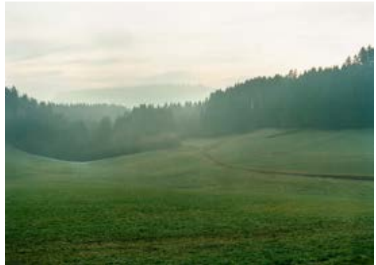
Bernhard Fuchs, Hollerberg, Frühjahr 2013, © Bernhard Fuchs, courtesy Josef Albers Museum Quadrat Bottrop

Bernhard Fuchs, Waldungen, bis 10. August im Josef Albers Museum, Quadrat Bottrop, Tel. 02041/29716. Das Buch dazu ist bei Koenig Books, London, erschienen.