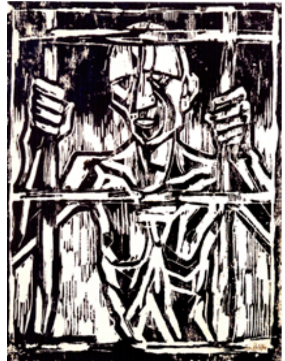
Christian Rohlfs, Der Gefangene, 1918, Holzschnitt auf Papier, 64 x 49,5 cm, Osthaus Museum Hagen

naiv in den Krieg gegangen ist, bestätigt ein Selbstbildnis, das ihn als Rekruten noch vor dem Einsatz an der Front zeigt: mit kahlgeschorenem Kopf, die Augen tief in ihren Höhlen, unruhig vom Licht erfasst. Dix blickt über die Schulter, dabei wirkt er wie auf der Flucht, aufgeschreckt und alles andere als ein Held. Dix beschreibt hier die Erkenntnis, dass das Schicksal nicht mehr in seiner Hand liegt. Deutlich wird: Der Krieg ist ein einschneidendes Ereignis, welches das ganze Leben verändert.