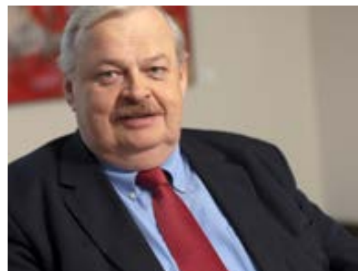
Hat vor geraumer Zeit mit dem Vorschlag, EU-Gelder zur Integration umzuwidmen, Aufsehen erregt: NRW-Minister Guntram Schneider.