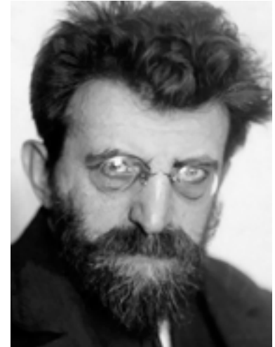
Erich Mühsam, Fotografie aus dem Jahr 1928, kurz vor seinem 50. Geburtstag.

ungehobeltes Brett, außen wie innen ohne Klinke; sie schnappte beim Zuschlagen ins Schloss und konnte nur mit einem mächtigen Scheunentorschlüssel geöffnet werden. Der unbezahlbare Vorzug der Behausung war aber das Fenster, das, vom Hofe aus nicht erreichbar, in die das ganze Anwesen rückwärts abschließende Mauer eingelassen war und ins dichte Kieferngehölz hinauszeigte. Verließ ich mein Zimmer auf diesem Wege, so brauchte ich bloß einiges Gebüsch und Gestrüpp zur Seite zu kämpfen und befand mich auf der schönen Waldchausee zwischen Friedrichshagen und Köpenick. So gelang es mir mehrmals, unwillkommenen Besuchen behördlicher Persönlichkeiten auszuweichen, und einmal konnte ich auch ein junges Mädchen aus dem Rheinland, dem es in unserer Friedrichshagener Gesellschaft besser gefiel als zu Hause, durch mein von keiner Straße sichtbares Fenster den Armen der ihr nachjagenden Mutter entreißen. ff