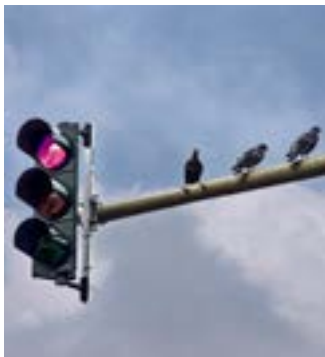
Nur die Tauben waren Zeugen.