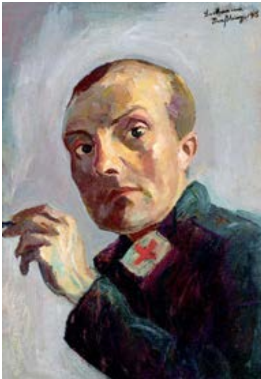
Max Beckmann, Selbstbildnis als Krankenpfleger, 1915, Öl auf Leinwand, 55,5 x 38,5 cm, Kunst- und Museumsverein Wuppertal