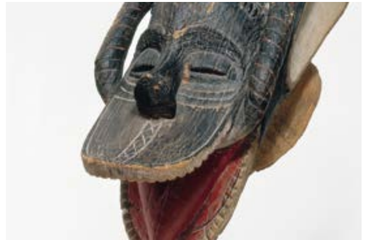
Meister der Yasua, Helmmaske, um 1930.

28.6. bis 5.10., Bundeskunsthalle Bonn, Friedrich-Ebert-Allee 4, Di-Mi 10-21 Uhr, Do-So 10-19 Uhr