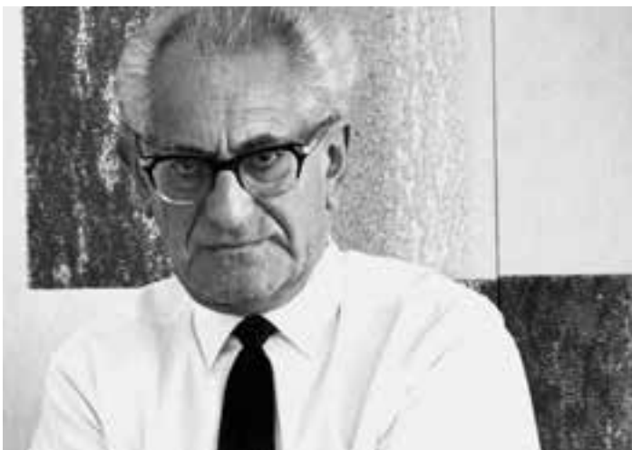
„Wenn ich mein Dienstzimmer verlasse, betrete ich feindliches Ausland“: Fritz Bauer, hier in einer Aufnahme von 1965.