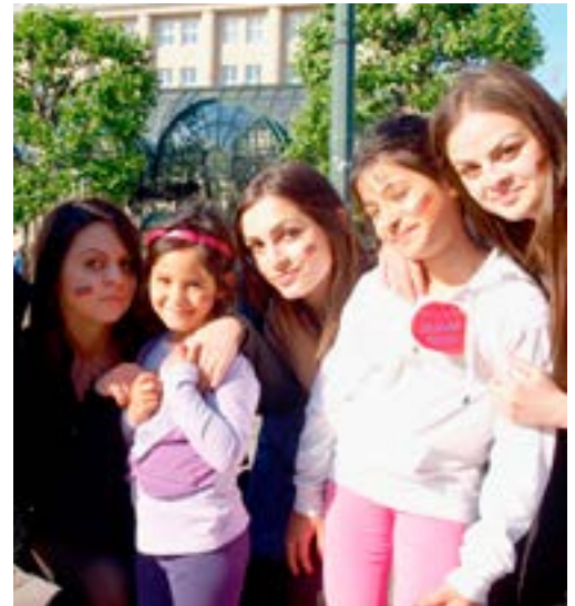
Der Anteil von Rumänen und Bulgaren an den Hartz-IV-Beziehern liegt bei nur 0,7 Prozent.