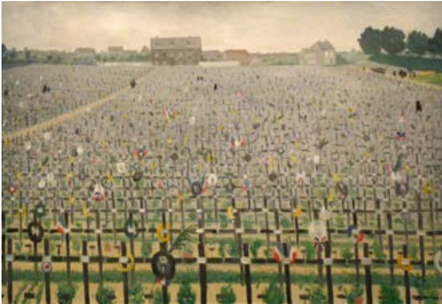
Félix Vallotton, Soldatenfriedhof von Châlons-sur-Marne, 1917, Öl auf Leinwand, 54 x 80 cm, Bibliothèque de Documentation Internationale Contemporaine