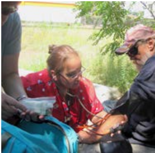
Kuchen backen für die Obdachlosenpflege von Care 24 in Düsseldorf. Außerdem wurden 2 Container Sachspenden gesammelt.