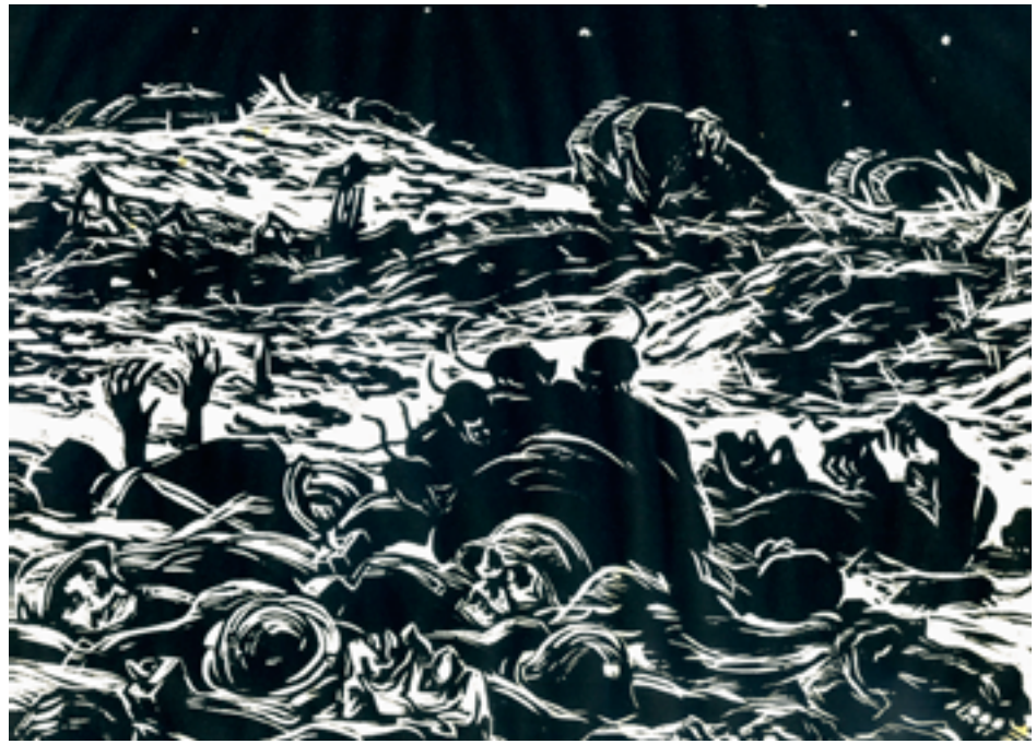
Hans Slavos, aus der Mappe „Erster Weltkrieg und Revolution“, um 1918/20, Holzschnitt auf Papier, Osthaus Museum Hagen, © Nachlass Slavos

Tod. Diese Schlacht ist Mahnmal dafür, das es im Krieg nur Verlierer gibt; heute gilt der Ort als Symbol für die deutsch-französische Aussöhnung. Ein bedeutendes Gemälde der Wuppertaler Ausstellung, das die unermessliche Anzahl an gefallenen Soldaten thematisiert, stammt von Félix Vallotton. Vallotton zeigt einen Soldatenfriedhof mit Reihen von Kreuzen, die sich steif, reglementiert und unbeseelt als Absperrungen bis zum Horizont ziehen. Aber er zeigt nicht nur die unfassbare Menge gestorbener Menschen, sondern er weist mit einzelnen Details zwischen den Gräbern darauf hin, dass jeder Tote ein einzigartiger Mensch war, dem sein Leben geraubt wurde und der trauernde Angehörige hinterließ.