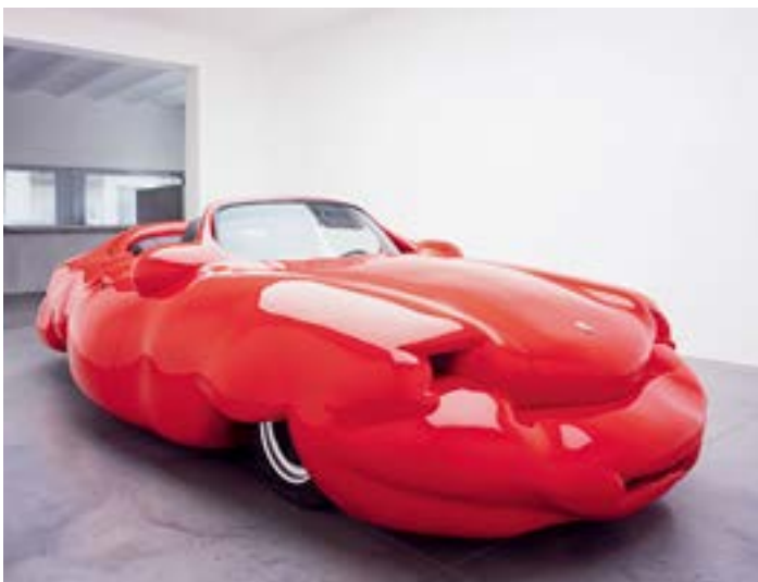
Geschwollener Porsche: „Fat Car Convertible“ von Erwin Wurm.