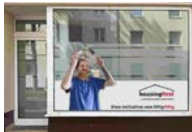
In unmittelbarer Nähe zur Beratungsstelle hat fiftyfifty ein Housing-First-Büro eingerichtet. Auch ein Umzugstransporter wurde angeschafft. Gestaltung: Heike Hassel / Peter Lauer, in puncto