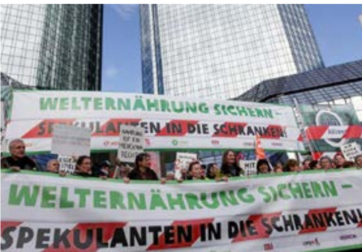
Hier stehen wir, wir können nicht anders: Protest in Frankfurt.