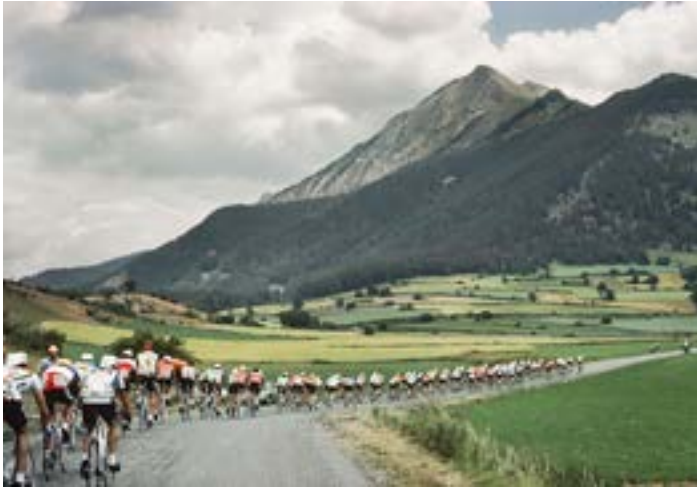
Auf dem Weg in die Alpen.