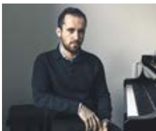
Igor Levit, mal nicht aus Reihe 20 geknipst.