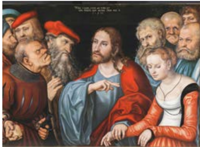
Lucas Cranach d. Ä., Christus und die Ehebrecherin, 1532, Malerei auf Lindenholz, 82,5 x 121 cm, Szépművészeti Múzeum, Budapest

L ucas Cranach der Ältere (1472-1553) war ein genialer Maler, dazu hoch produktiv und schon zu seiner Zeit angesehen. Als Hofkünstler im Dienst von Friedrich von Sachsen lebte er ab 1505 in Wittenberg, dem Zentrum für den aufkommenden Humanismus und die Reformation. Hier lernte er Martin Luther kennen, befreundete sich mit ihm und porträtierte ihn mehrfach. Vor allem dank