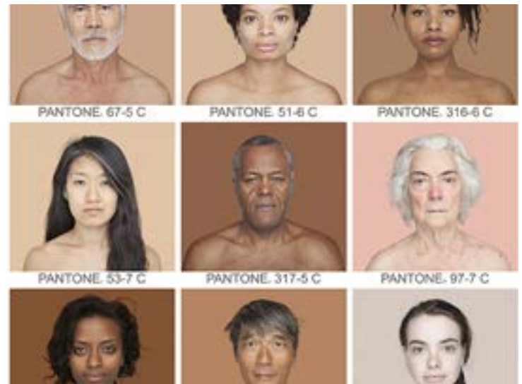
Jeder Mensch ist Ausländer – fast überall.

Neanderthal Museum, Talstraße 300, 40822 Mettmann; bis 5. 11.