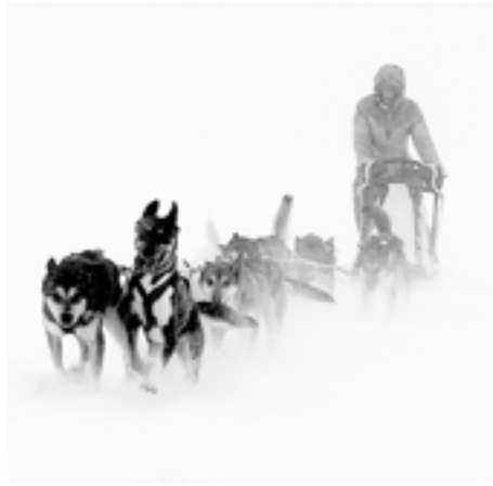
Diesen Kunstdruck gibt es für 120 Euro als Edition (Digitalprint ca. 30 x 40 cm, handsigniert) in der fiftyfifty -Galerie zu kaufen.