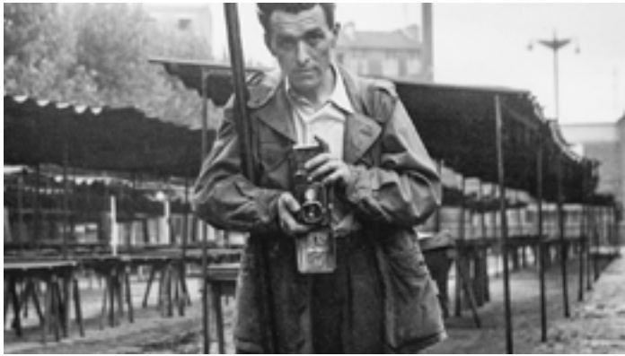
„Ungehorsam und Neugier“ hätten ihn angetrieben, sagt Robert Doisneau.