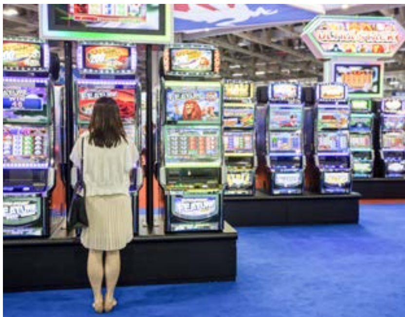
Geldspielautomaten der neuesten Generation auf der Global Gaming Expo 2014.

Sie haben verheißungsvolle Namen wie Volcano Cash, Magic Mirror, Dragon's Treasure, oder Magie Super Multi. Das sind nicht mehr die lahmen elektromechanischen Walzengeräte von einst. Heute handelt es sich bei den Geldspielgeräten um superschnelle Multi Game Stations mit Bildschirmoberfläche und variablen Einsätzen. Casinos im Kleinformat, die für viele Menschen eine große Anziehungskraft ausüben. Die Hemmschwelle ist niedrig. Die Geldspielautomaten sind leicht zugänglich und schon mit 10 Cent ist man dabei. Die Regeln sind banal. Es geht es darum, eine festgelegte Kombination von Symbolen auf drei oder vier rotierenden Walzen zu erzielen. Durch Stopp- und Risikotasten werden die Spielenden aktiv ins Spiel einbezogen und erhalten so den Eindruck, den Spielausgang beeinflussen zu können. Eine Illusion: Die Ausschüttungsquote bleibt immer gleich. Etwa 60 Prozent der Einnahmen werden ausgezahlt, die restlichen 40 Prozent sind Erlös der Automatenindustrie. Was heißt: auf Dauer verliert der Spieler immer mindestens 40 Prozent seines Einsatzes. Durch häufige „Fast-Gewinne“, etwa wenn nur zwei statt der drei benötigten Symbole auftauchen, oder durch eingestreute Kleingewinne wird der Spieler an den Automaten gebunden. Gewinne kann er sich sofort auszah-