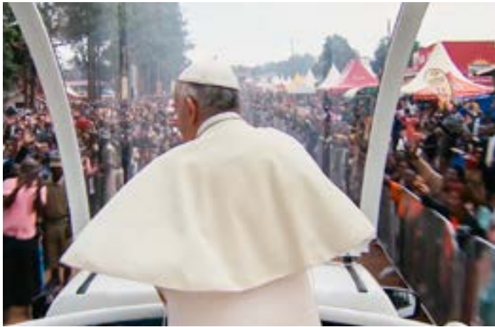
Umjunkt von den Mühseligen und Beladenen: Papst Franziskus.