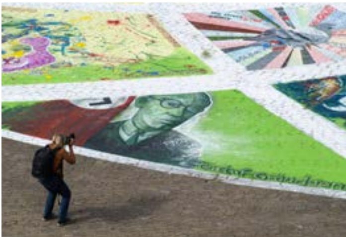
Bildteppich vor dem Schauspielhaus, Urban Art Festival 2015.