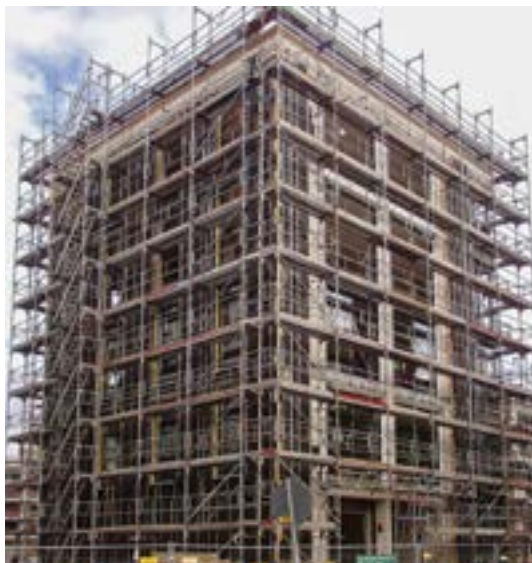
Randlagen von Großstädten verwandeln sich in Luxusviertel – bisher ohne Auswirkung auf die Grundsteuer. Baustelle in Düsseldorf.

Die Wohnungsspekulanten sollen darüber herzhaft gelacht haben. ff olaf cless