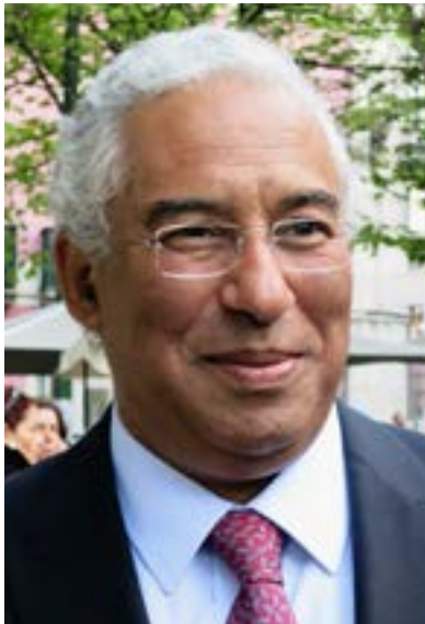
Portugals Ministerpräsident António Costa setzt sich für Housing-First ein.