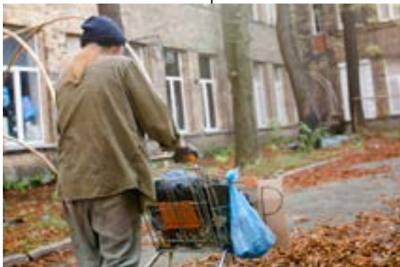
Fühlt er sich unbeobachtet, sieht man ihm seine Einsamkeit an.