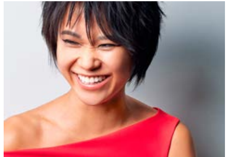
Charmante Draufgängerin: die chinesische Pianistin Yuja Wang.

Das Klavier-Festival endet am 13. 7. in Essen; die beiden Education-Präsentationen finden jeweils um 18 Uhr im Landschaftspark Nord/Gebläsehalle statt; klavierfestival.de