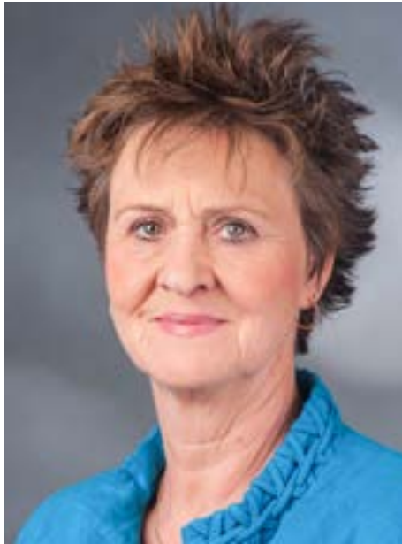
Linken-Abgeordnete Sabine Zimmermann prangert die „Verarmung breiter Bevölkerungsteile“ an.

Linken-Abgeordnete Zimmermann wertete die hohe Zahl der Hartz-IV-Empfänger über die Jahre als Zeichen der „Verarmung breiter Bevölkerungsteile“. Die verschiedenen Bundesregierungen hätten im Kampf dagegen versagt, sagte die arbeitsmarktpolitische Sprecherin der Linken-Bundestagsfraktion. Es sei „besonders bitter, dass auch so viele Kinder die Erfahrung des entwürdigenden Bezugs von Hartz-IV-Leistungen machen“. Die Leistungen schützten nicht vor Armut und gewährleisteten keine angemessene Teilhabe an der Gesellschaft, sagte Sabine Zimmermann.