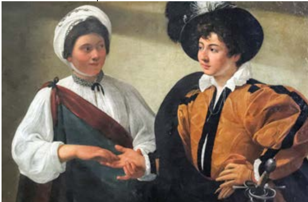
Die Wahrsagerin, Gemälde von Caravaggio (1596/97); Paris, Louvre. Der junge Edelmann merkt nicht, dass die Handleserin ihn „abzieht“: Während sie mit dem Zeigefinger seine Aufmerksamkeit auf die „Liebeslinie“ lenkt, streift sie ihm mit der anderen Hand den Ring ab.

Mir reicht es. Was da sonst noch an materialisiertem Aberglauben angeboten wird, lasse ich links liegen, wie die Magnetfeld-Matten, die nicht nur Asthma und Hexenschuss heilen, sondern auch gegen Impotenz wirken sollen; zur „Geistigen Wirbelsäulenaufriechung“ für 135 Euro zieht es mich ebenfalls nicht, ebenso wenig zum Fingerkuppenlesen, den Licht-Nahrungsergänzungsmitteln auf Bergkristallbasis oder zu den Chi-Maschinen, die für wenige hundert Euro „Körper und Geist wieder in Schwung zu bringen“ versprechen. Allerdings gönne ich mir noch einen Becher mit „energetisiertem Wasser“, das „mehr Lebensenergie, Lebenskraft und Gesundheit“ verspricht. Die Energetisierung, so wurde ich informiert, erfolgt durch Verwirbelung des Wassers mit einem speziellen Gerät und die Schwingungen von Edelsteinen. Manchmal auch durch Musik und Besprechung. Das Wasser schmeckte nicht übel. Zum Kauf eines Wasserwirblers zur Energetisierung für 179 Euro - plus Edelsteinkosten für die benötigten Schwingungen - konnte ich mich dann doch nicht entschließen. Am Ausgang warf ich einen letzten Blick zurück und musste an Sokrates denken. Sich auf dem Athener Marktplatz umschauend, soll er gesagt haben: „Wie zahlreich sind doch die Dinge, derer ich nicht bedarf.“ ff