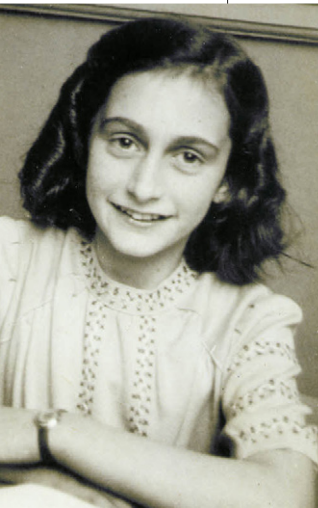
Anne Frank (1941)