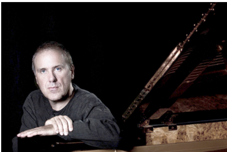
Pianist mit weitem Horizont: Alexander Lonquich.

29. 1., 20 Uhr (Premiere), 31.1., 1.2., 6.2., 8.2., FFT Kammerspiele, Düsseldorf, Jahnstr. 3, Tel. (0211) 876787-18