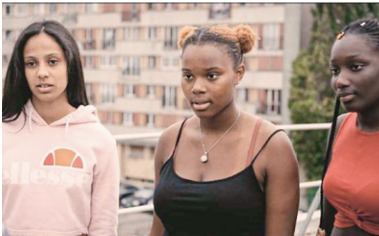
Wird hier etwa Gras geraucht? Szene aus „Die Wütenden“.