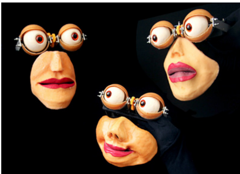
Vertrauen Sie ganz diesen drei posthumanen Grazien!

U. a. am 5. 2. in Düsseldorf (Jazz-Schmiede, 20.30 Uhr), 13. 2. Wuppertal, 16. 2. Solingen, 19. 2. Köln; klangkosmos-nrw.de