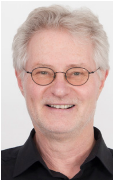
Olaf Cless ist Kulturredakteur von fiftyfifty .

fiftyfifty auf VOX und STERN TV 4 Sendungen ab 5.2. (siehe auch S. 9)