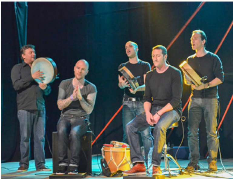
Fünf Troubadoure aus Marseille: Lo Còr de la Plana.