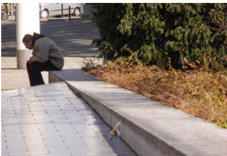
Straßenbegleitgrün an Versiegelung.