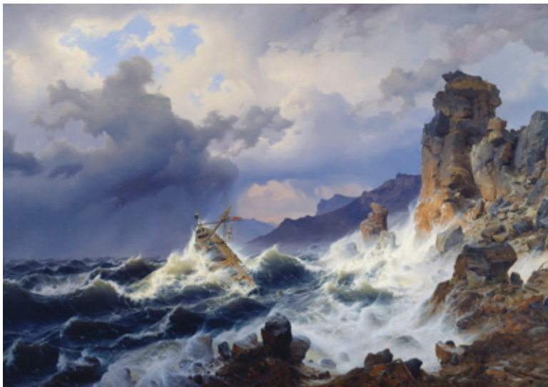
Höchste Dramatik: Andreas Achenbach, Seesturm an der norwegischen Küste, 1837