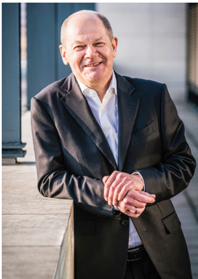
SPD-Kanzlerkandidat Olaf Scholz will Ausbeutung und illegalen Beschäftigungsverhältnissen den Kampf ansagen.