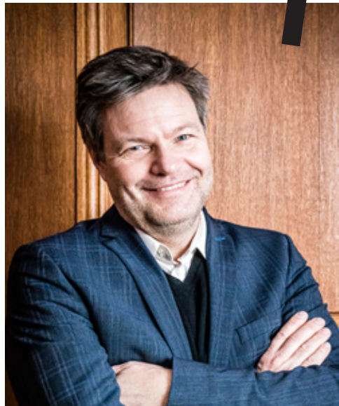
Grünen-Chef Robert Habeck: „Wir wollen Hartz IV überwinden.“