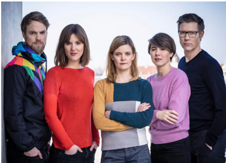
Die Moderator*innen von „mal angenommen“.