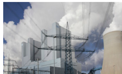
Mit Braunkohle gegen die Ökodiktatur: RWE-Kraftwerk Neurath.

„Es geht“, schrieb kürzlich Heribert Prantl, „um die Umstellung des Lebens, nicht nur, wie bei Corona, für ein paar Monate, sondern für immer – aus Solidarität mit noch ungeborenen Menschen. Die Rückkehr zur Normalität wird es nicht geben können, weil die Normalität die Ursache der Klimakrise ist.“