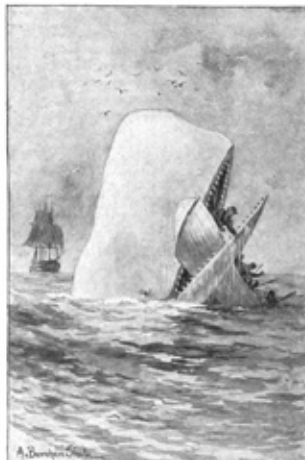
Moby Dick, einer der vielen von Verlagen abgelehnten Klassiker. Illustration aus einer frühen Ausgabe (1892).

Nicht selten sind Ablehnungen wegen politischer Bedenken. Animal Farm etwa, die satirische Parabel des bekennenden Sozialisten George Orwell auf das Scheitern der Russischen Revo-