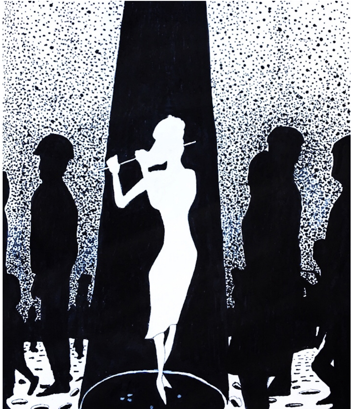
Darius Glöckner, Flötenspielerin, Tuschezeichnung, 2018