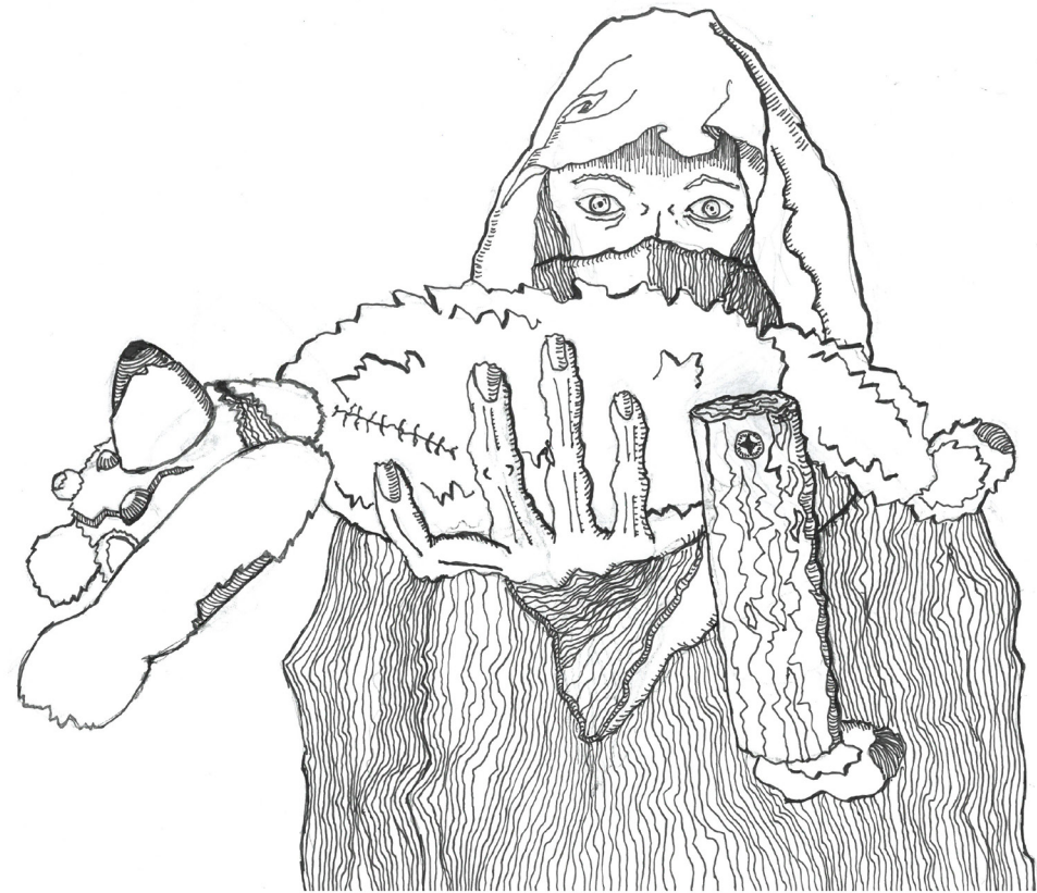
Oskar Fabritz, Weihnachtsabend, Tuschezeichnung, 2018