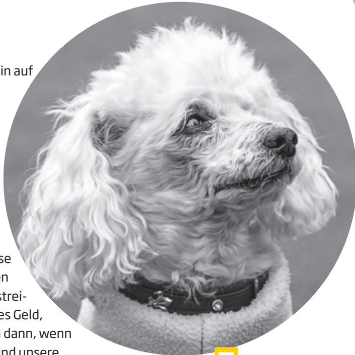
Luna: beste Freundin von fiftyfifty -Verkäufer....